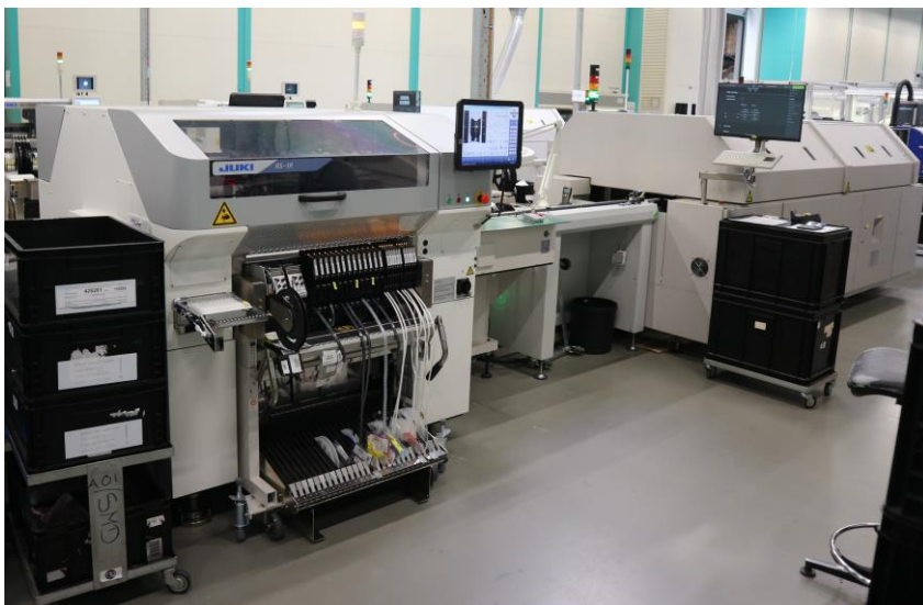
Juki RS1-R mit Tray Wechsler

Der zusätzliche Juki Tray- Wechsler mit seinem Magazin für 20 Einschübe sorgt für den nötigen Nachschub an unterschiedlichen Bauteilen.