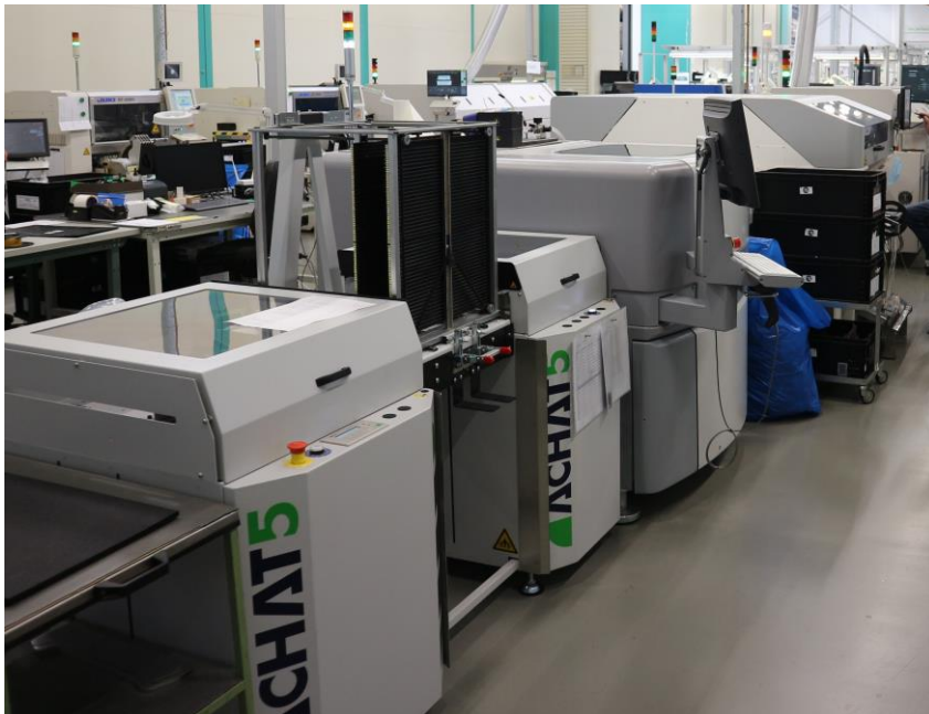
Neue Linie 2

Der neue Belader von Achat5 versorgt nun mit passender Geschwindigkeit die aktuelle Version des Jetprinters von Mycronic mit Platinen zum Pastendruck.