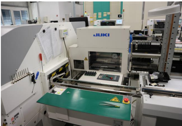
Juki Matrix Tray Wechsler

Wir investieren in die Zukunft und bleiben immer auf dem Laufenden, um den Anforderungen unserer Kunden gerecht zu werden und um mit höchster Qualität zu produzieren.