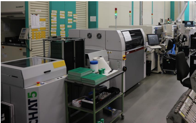
Neue Linie 1

Die Linie 1 besteht durch eine Linienkonfiguration, die, wie auch die Linie 2, eine tadellose Übergabe der Baugruppen in die nächste Maschine gewährleistet.